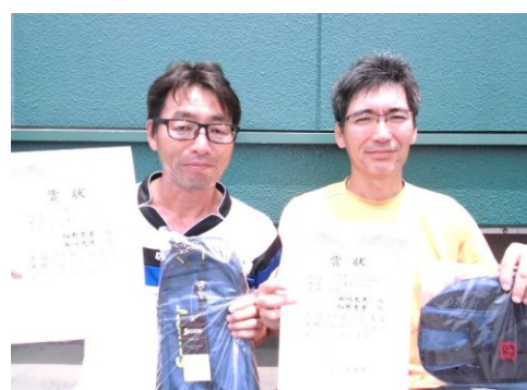
《ベテラン男子優勝》

日 程 7月 1日 (土) 9:00am 8日 (土) 9:00am 9日 (日) 9:00am 22日 (土) 9:00am予備