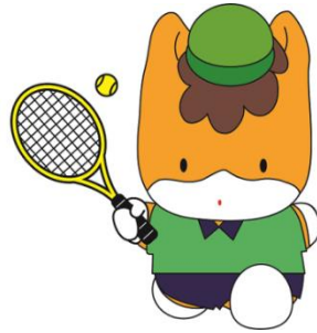
GUNMA CHAN 25-160124